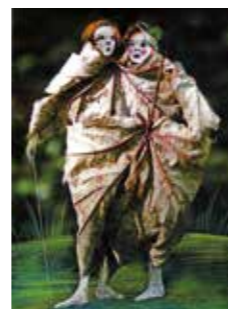
Mihail Chemiakin, Les voyageurs, Opéra « François Villon » , 2010

Atelier limité à 12 enfants. Tarif : 4 €. Réservations obligatoires auprès du service du Patrimoine : 02 47 59 48 21.