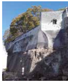
Le château et la forteresse de Loches en 1855, par Ferdinand Collet