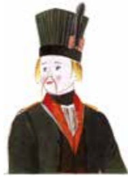
Mihail Chemiakin, Prétendant hongrois à la main de la princesse , 2000