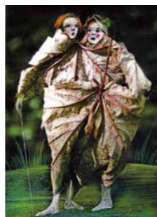
Mihail Chemiakin, Les voyageurs, Opéra « François Villon », 2010

Réservations obligatoires auprès du service du Patrimoine : 02 47 59 48 21.