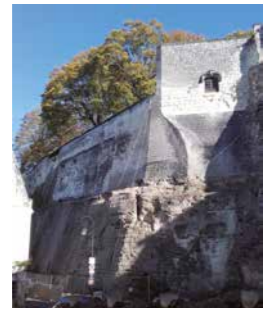
Le château et la forteresse de Loches en 1855, par Ferdinand Collet