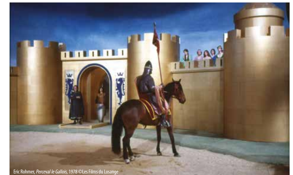
Eric Rohmer, Perceval le Gallois , 1978

« Le Cinéma fait son Moyen Âge » Du 14 mai au 11 octobre 2026 à la Cité royale de Loches (donjon et logis royal). Mai, juin, septembre et octobre : 9h30-18h, juillet et août : 9h30-19h. Tarifs : 12,50 € / 10,50 €. Gratuit -7 ans. Infos : citeroyaleloches.fr/agenda