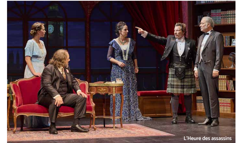
L'Heure des assassins

D'avril à novembre, de nombreux rendez-vous culturels et patrimoniaux vous attendent à Loches ! Nous avons de nouveau composé une programmation éclectique pour tous les publics : spectacles, concerts, théâtre, expos, visites guidées... à découvrir dans notre plaquette à paraître mi-mars.