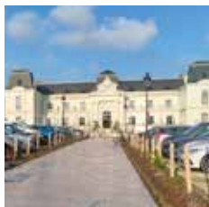
Le palais de justice Témoin de l'agrandissement de la ville au XIX e siècle, il fait partie des nouvelles constructions publiques de