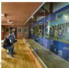
La galerie Saint-Antoine Accolée à l'église, elle accueille un précieux triptyque du XV e siècle attribué à Jean Poyer et les deux « Caravage