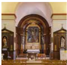
L'église Saint-Antoine Aménagée en 1812 dans l'ancien réfectoire du couvent des Ursulines, l'église contient de nombreuses