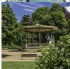
Le jardin public Aménagé au tout début du XX e siècle, le jardin public offre un panorama exceptionnel sur l'ensemble de la